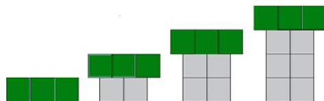
Слика 3. Растечки шаблон

Пример 2. Да го разгледаме растечкиот шаблон даден на Слика 3.