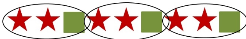
Слика 2. Повторувачки целини во шаблонот од Пример 1

в) Идентификација на повторувачката целина. Повторувачката целина се состои од најмалиот број елементи кои се повторуваат, по определениот редослед. Во повторувачкиот шаблон од Пример 1, таа целина е „свезда, свезда, квадрат“. Од учениците се бара да ги заокружат овие целини на цртежот (види Слика 2). Секако, може да има повеќе опции и предлози за изборот на оваа целина (други точни одговори за повторувачката целината се „свезда, квадрат, свезда“ и „квадрат, свезда, свезда“, доколку се смета низата од фигури дека е продолжлива и од лево и од десно). Но, важно е да се напомене дека, треба да се избере наједноставната претстава за повторувачката целина, затоа што оваа целина понатаму ја разгледуваме како генератор на шаблонот и треба да биде множество погодено за анализирање по број и состав на елементи. Затоа велиме дека шаблонот на Слика 1 го следи правилото ААБ.